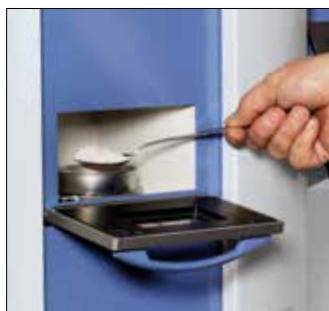
Análisis de muestras

Los datos también pueden entregarse a través de un puerto Ethernet (conexión LAN) a un sistema de adquisición de datos.