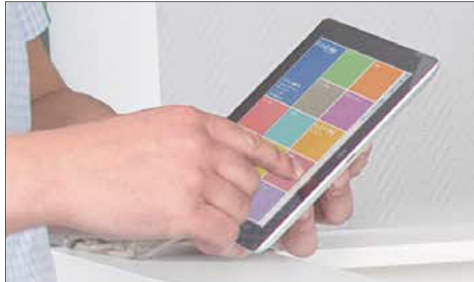
Brabender MetaBridge: Tabletanwendung